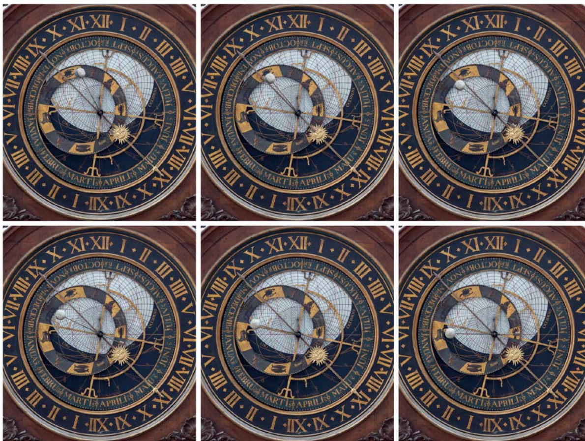
Cycle de la lune pendant 9 jours consécutifs.